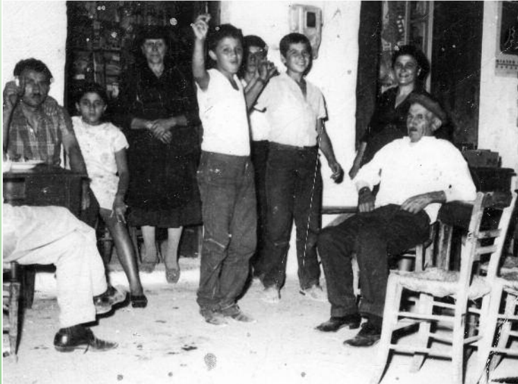
1970 Μπροστά στο καφενείο του Ποσειδώνα Σούνδια

Μέσα απ' αυτή την στήλη της εφημερίδας θα προσπαθήσουμε να φέρουμε στη μνήμη μας εικόνες και γεγονότα περασμένων δεκαετιών που έσωσαν και αποτύπωσαν σε ασπρόμαυρο φόντο παλιότεροι συγχωριανοί μας. Φωτογραφίες που αγγίζουν το χθες του καθενός μας και μας φέρνουν πίσω στα δύσκολα αλλά και ωραία εκείνα χρόνια που όλοι μας νοσταλγικά θυμόμαστε. Νομίζω ότι κάθε τέτοια στιγμή ίσως είναι κληρονομιά όλων και η δημοσίευσή της αποτελεί υποχρέωση αλλά και δικαίωμά μας να την μοιραζόμαστε.