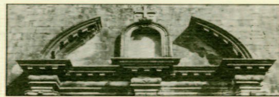
Υπέρθυρο στο ναό του Αγ. Μηνά

ΕΤΑΙΡΕΙΑ ΛΕΥΚΑΔΙΚΩΝ ΜΕΛΕΤΩΝ ΒΡΑΒΕΙΟ ΑΚΑΔΗΜΙΑΣ ΑΘΗΝΩΝ